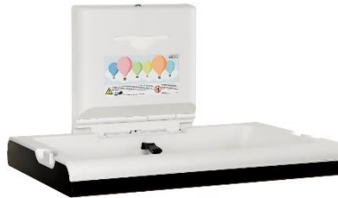
CP0016HCSB Polipropileno / Acero inoxidable Acabado negro mate