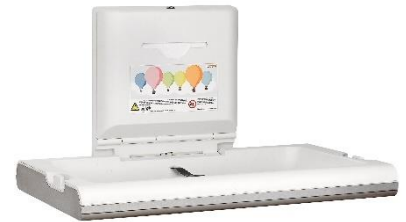
CP0016HCS Polipropileno / Acero inoxidable Acabado satinado