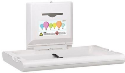
CP0016H Polipropileno Acabado blanco